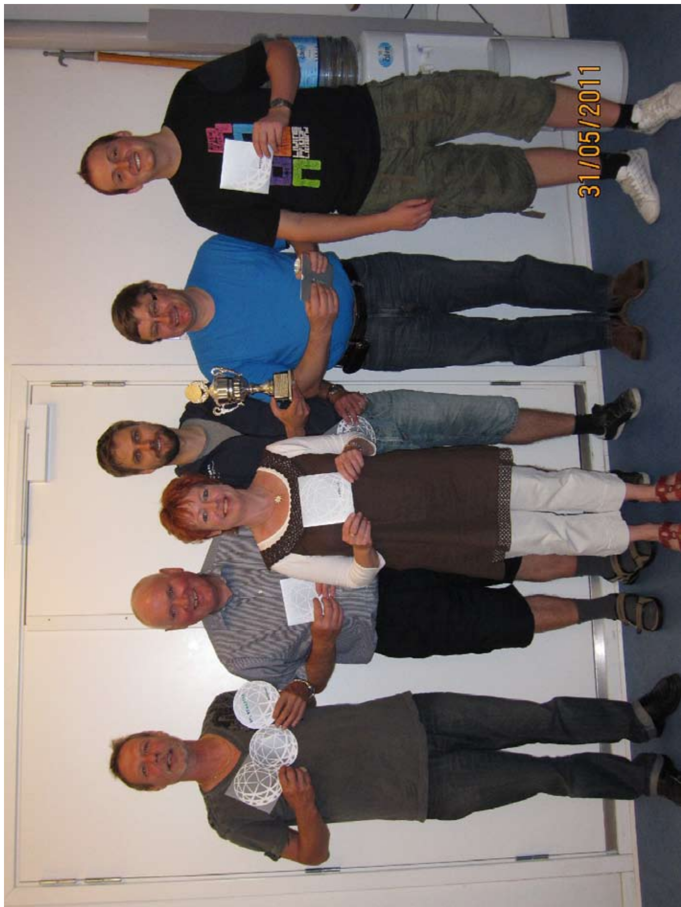
Vinderne af ANDERS OPEN 2011